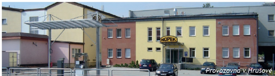
Provozovna v Hrušové

Řekl bych, že v tomto jsme průkopníci. Byli jsme vůbec první pekárnou v republice, která získala certifikovaný systém kritických bodů HACCP a mezi prvními, kdo měl výrobu certifikovanou podle standardu ISO. Dnes máme jeho vyšší nadstavbu FSSC 22000 a jsme držitelé certifikátu CEFF (potraviny bez konzervantů, umělých barviv, sladidel