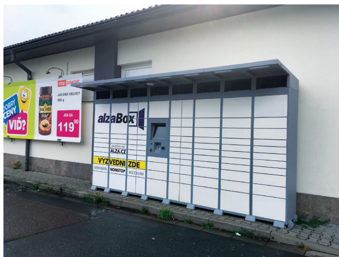
AlzaBox u prodejny COOP Diskont v Králíkách