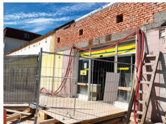
Probíhající stavební práce.